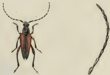
Leptura melanura .